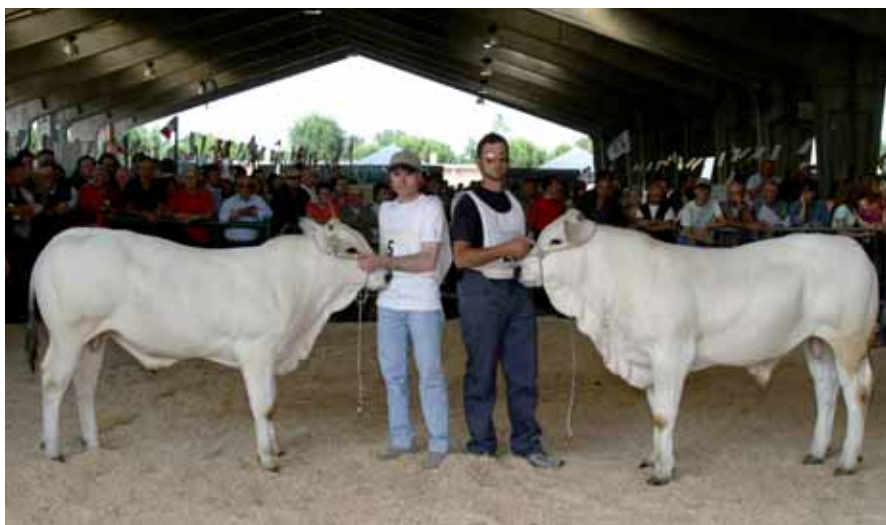
Da destra: Senato e Soffio, campione e riserva assoluti junior di mostra