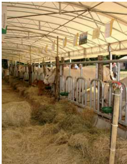
Panoramica degli animali in mostra

In occasione della manifestazione agricola della Valle del Vomano, organizzata nei giorni dal 01 al 03 giugno 2007, nell'area adiacente il campo sportivo di Villa Vomano, si sono potute ammirare delle valide realtà zootecniche della provincia di Teramo, chiamate a rappresentare le potenzialità del territorio abruzzese in campo allevatorio.