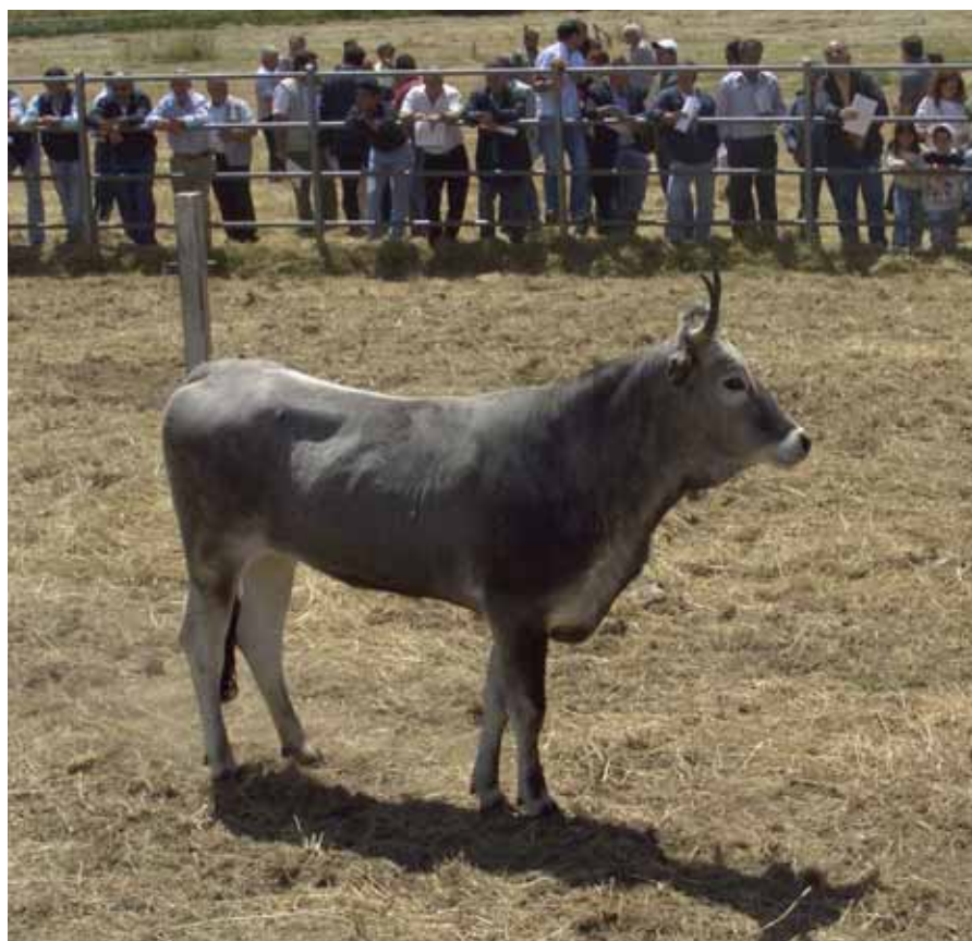
A sinistra e sopra due delle manze aggiudicate in asta

di quello appena concluso. La finalità principale del Centro di Selezione è quella di incentivare l'allevamento in purezza di questa razza attraverso la valorizzazione della linea femminile, promuovendo il miglioramento genetico, attraverso il controllo delle prestazioni individuali su femmine dagli elevati standard genealogici, morfologici e sanitari, senza tralasciare gli obiettivi di selezione principali, ovvero il mantenimento dei caratteri di tipicità razziale e rusticità, il potenziamento dell'attitudine riproduttiva e il soprattutto il miglioramento degli incrementi ponderali e delle masse muscolari. La strada è ancora lunga, ma la Podolica è già in vista dei suoi primi, importanti traguardi. In chiusura di queste note ci preme rivolgere un caloroso e speciale ringraziamento per la preziosa collaborazione al Dr. Giuseppe Scarnati, responsabile del Centro di Molarotta e al suo staff, oltre che a Piero Maffei, direttore dell'APA di Cosenza, ad Antonio Arnone, al Dr. Federico Barbuscio, che ha seguito le manze sotto il profilo ginecologico, e agli altri tecnici dell'APA, impegnati sul campo insieme a noi nel portare a compimento questo primo ciclo di prova.