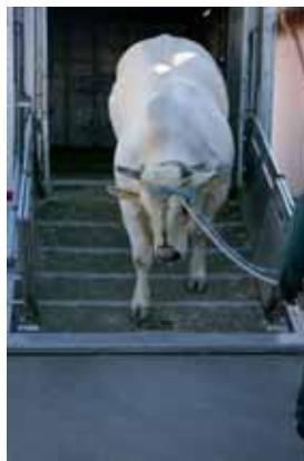
L'arrivo di Palio in Olanda

i nostri ospiti hanno concluso la loro visita nelle Marche acquistando ben 12 capi e alcune centinaia di dosi di seme.