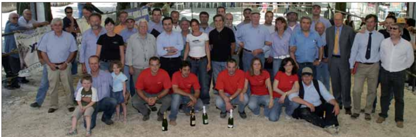
I tecnici e gli allevatori presenti in mostra

In un clima disteso e sereno le premiazioni sono proseguite con la consegna di una targa di partecipazione a tutti gli allevatori intervenuti. Con le foto di gruppo e il brindisi finale si è così conclusa in allegria una mostra ben riuscita, che ha permesso alla razza di presentarsi al meglio e agli allevatori di confrontarsi in un clima sereno che è stato certamente il connotato più piacevole di questa Nazionale Romagnola 2007.