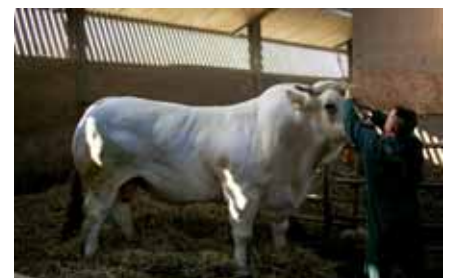
Palio nella sua nuova stalla

L'allevamento Ercoli ha esportato una manzetta coccarda gialla in mostra mentre l'allevamento Minutelli un nutrito lotto di giovani manzette allevate al pascolo e figlie del riproduttore Leonetoro testato al Centro Genetico di Perugia.