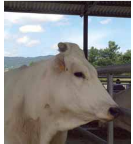
Una delle manze in asta

zioso pranzo, a base di chianina, per suggellare le caratteristiche organolettiche di una carne di eccellente qualità. L'appuntamento è per il prossimo anno, con il secondo ciclo di manze, che speriamo possa avvicinare e coinvolgere un numero ancora più elevato di allevatori.