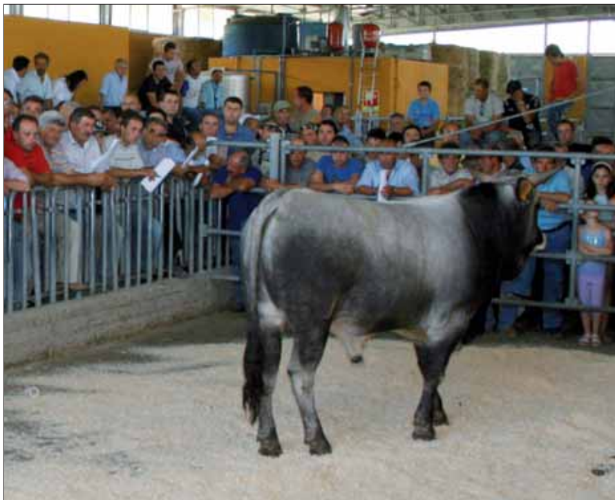
Un momento dell'asta al centro genetico di Laurenzana