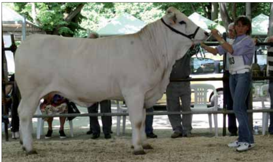
Primula delle Querce - Az. Agr. F.lli Daga, campionessa assoluta senior di mostra