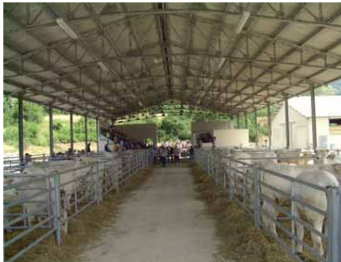
Panoramica delle strutture del Centro Manze di Ponte Presale