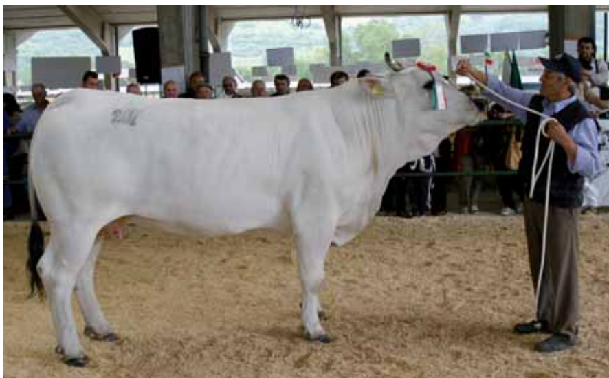
Ombrella - Az. Agr. Vissani Danilo, vincitrice del trofeo intitolato a Lucio Migni

Le finaliste allineate hanno costituito inoltre la migliore cornice all'attribuzione del trofeo riservato alla vacca con la migliore carriera produttiva e intitolato