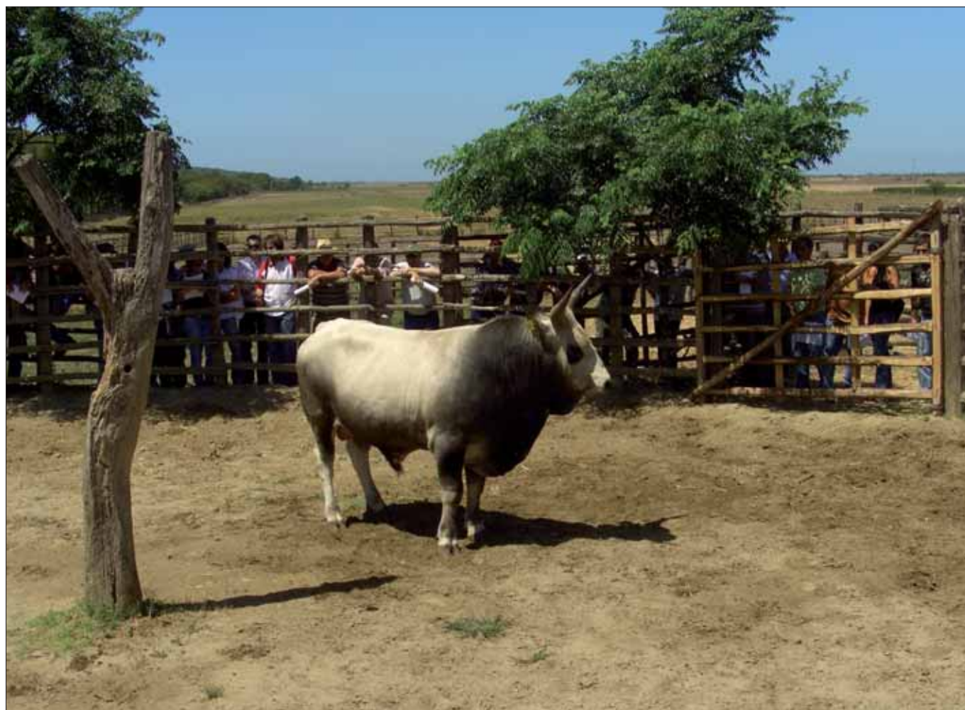
Uno dei torelli in asta presso il centro genetico di Alberese