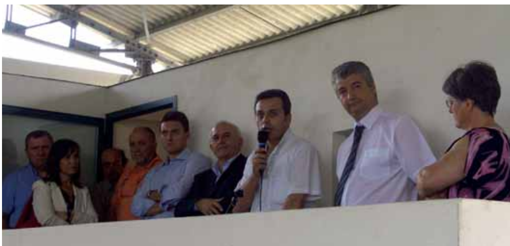
Le autorità intervenute