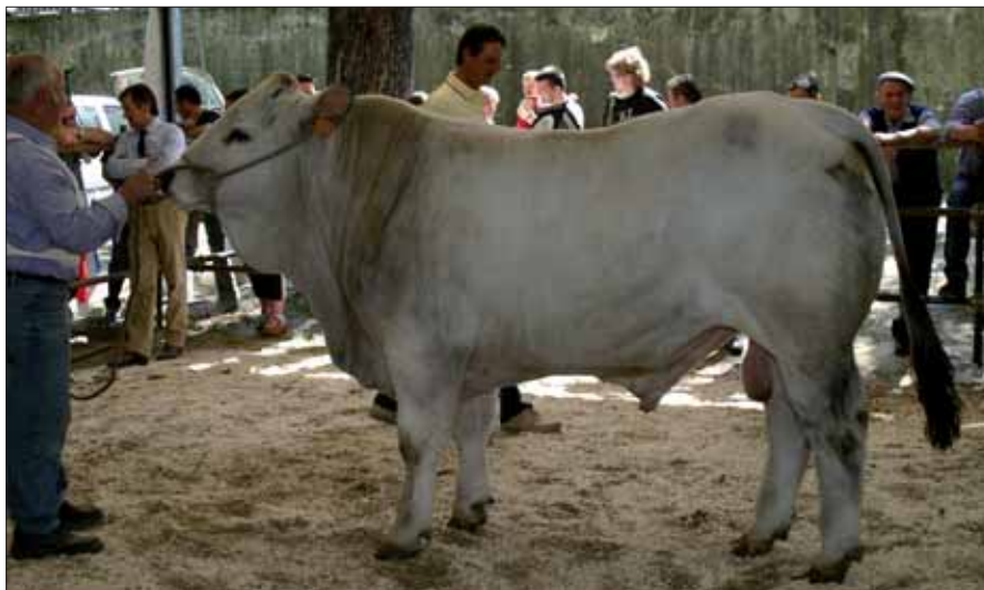
Serpico - Az. Agr. Poggioli di Fiumicello, campione assoluto junior di mostra