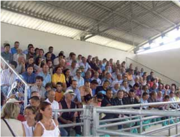
Il pubblico presente

zioso pranzo, a base di chianina, per suggellare le caratteristiche organolettiche di una carne di eccellente qualità. L'appuntamento è per il prossimo anno, con il secondo ciclo di manze, che speriamo possa avvicinare e coinvolgere un numero ancora più elevato di allevatori.