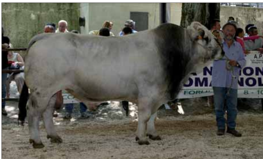
La Viola Orto - Az. Agr. La Viola, campione assoluto senior di mostra