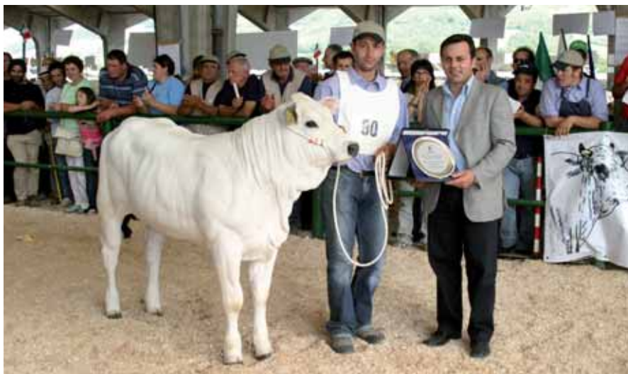
Santa - Az. Agr. "La Bigotta", campionessa di riserva assoluta junior di mostra

Anche la finale Senior è stata onorata dalle molte fattrici di grande spessore e