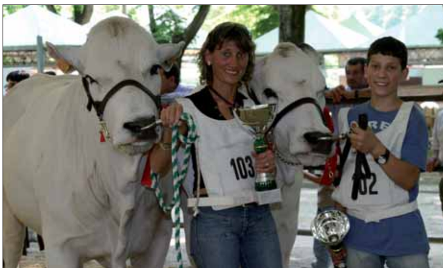
Miglior gruppo di allevamento Az. Agr. Mezza Cà F.lli Daga