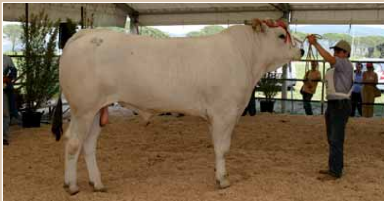
Rocco, campione assoluto senior della mostra Nazionale Chianina 2007.